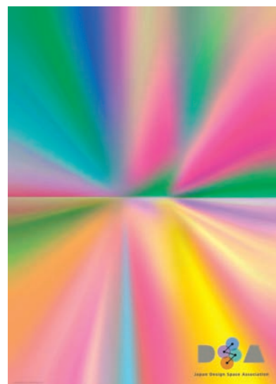
DSA日本空間デザイン協会ポスター 2012

仁木 先生の作品にはブリーツプリーのポスターなど、ひと目で勝井三雄作品とわかる美しい光の色のようアートポスター的作品ともうひとつのお仕事として、ピクトグラムや装丁がありますね。ご本人はひとつなのかもしれませんが、一般にはこの二つはまったく違うもので、片方しかできない方が多い…と思います。感