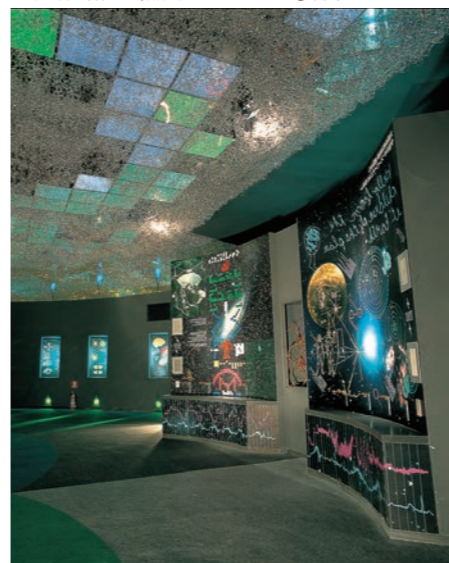
つくば科学博覧会「講談社ブレインハウス」内部 1985

昔の青山通りは都電が走っていたけれど、それがマラソンコースになって競技場につながったのですよ。成長期で非常にいろいろな意味で、